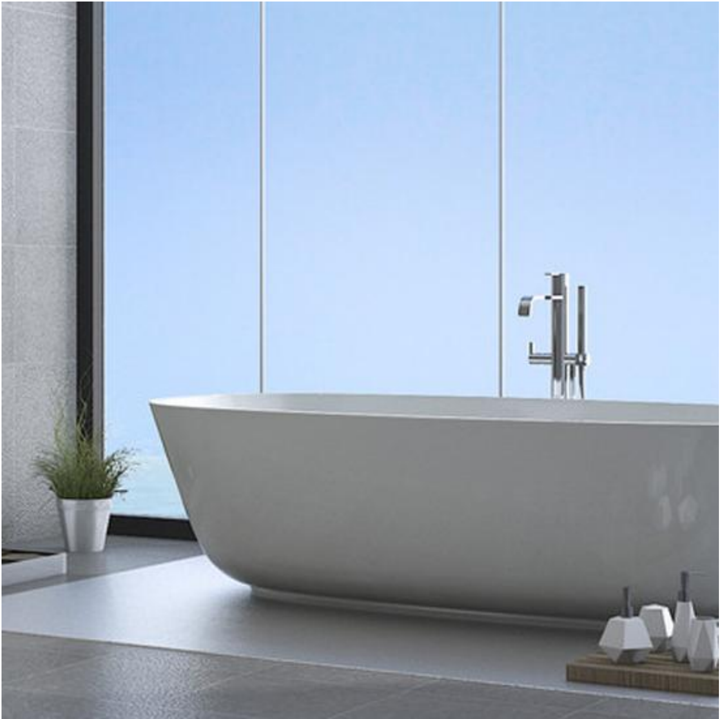
Parois de douche et bain