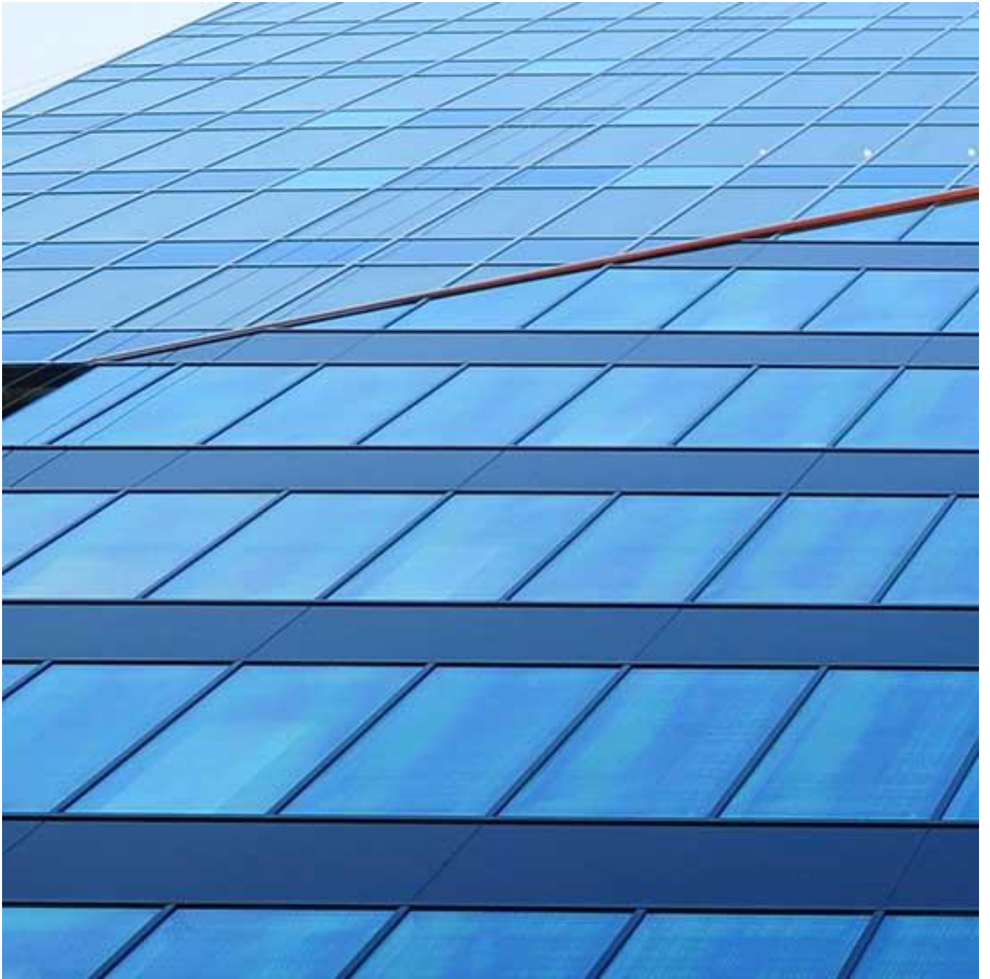
COOL-LITE SKN 154