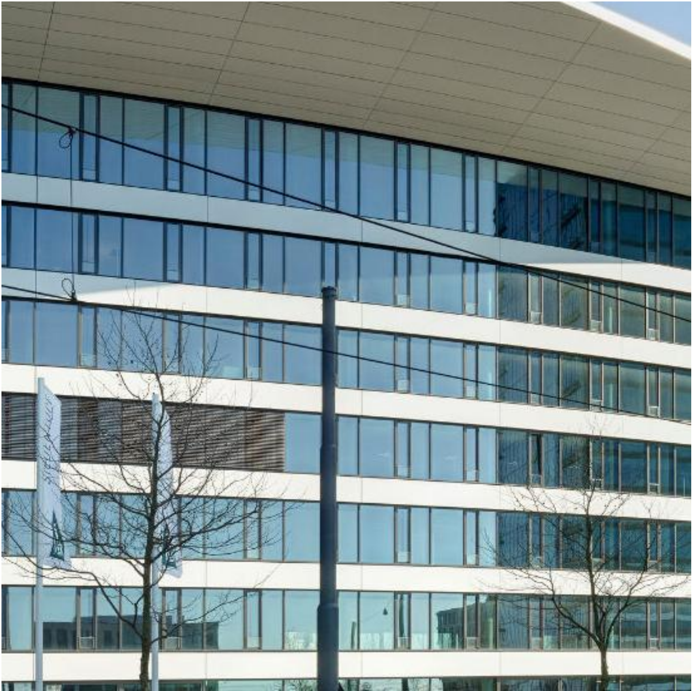
COOL-LITE SKN 176