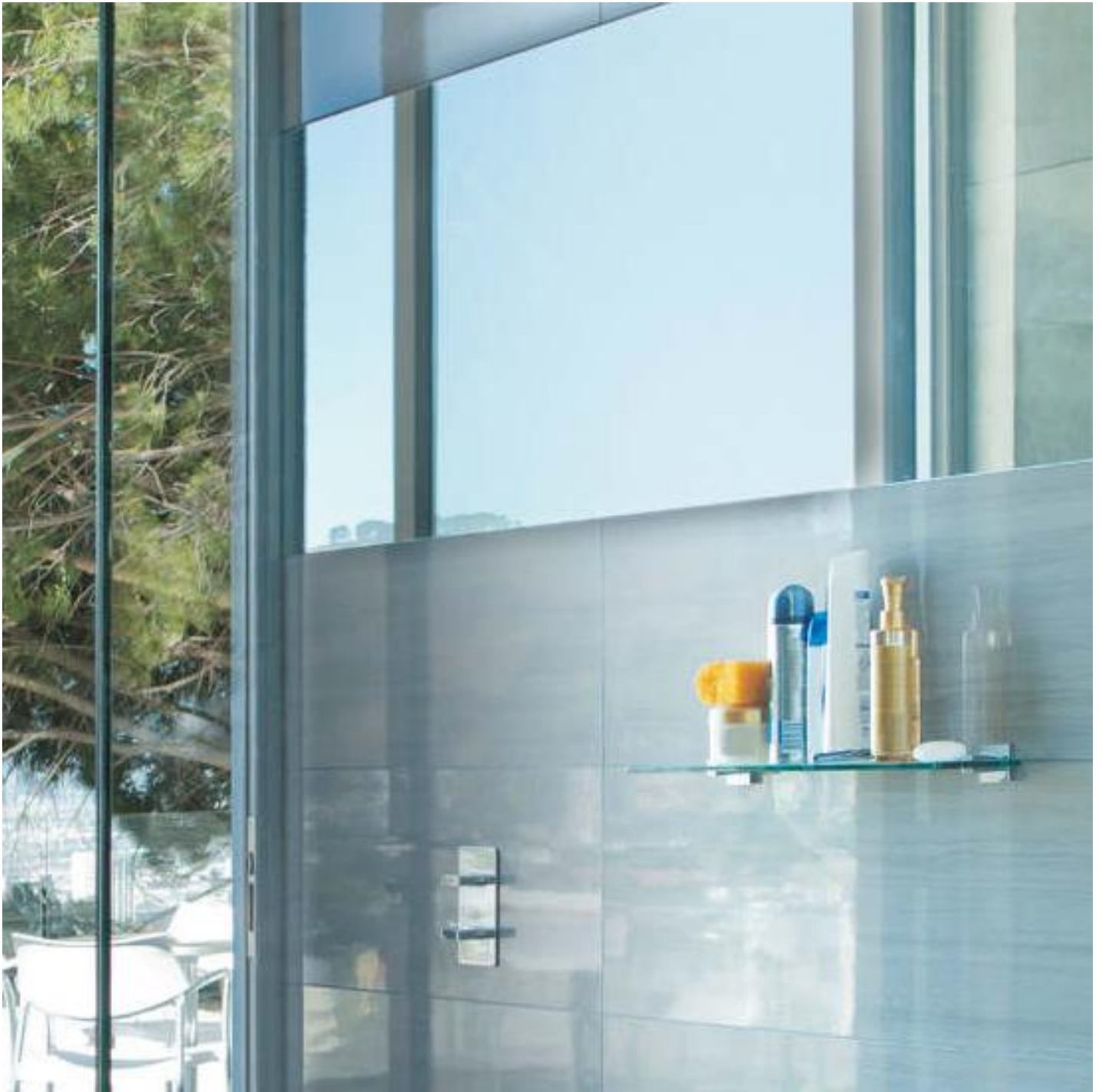
TIMELESS GLASS SHOWER