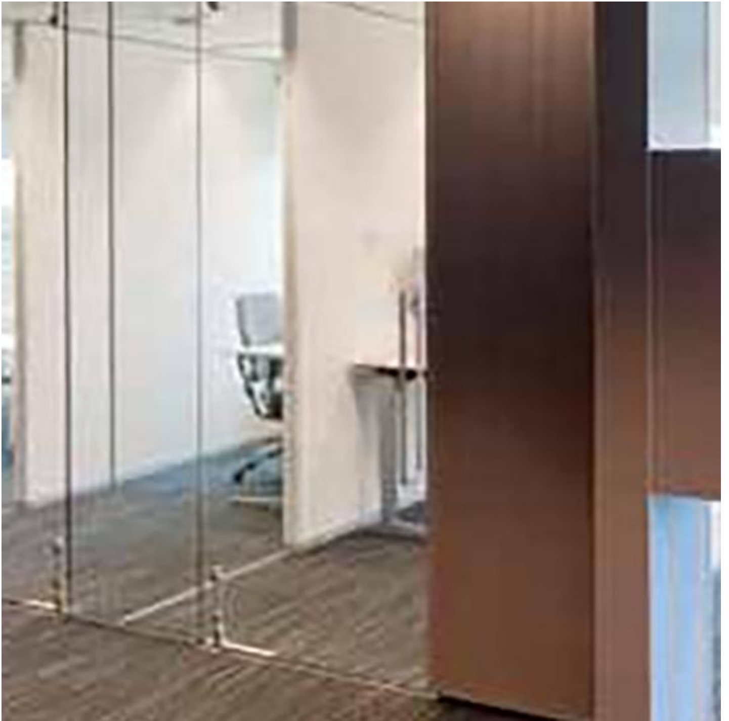
SYSTEMS CLIP-IN (SILENCE)