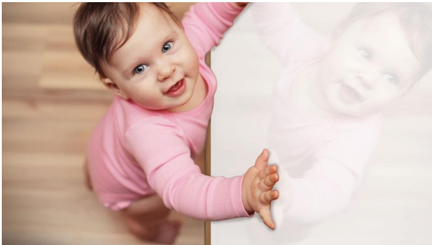
Verre laqué PLANILAQUE COLOR-IT | Saint-Gobain Building Glass