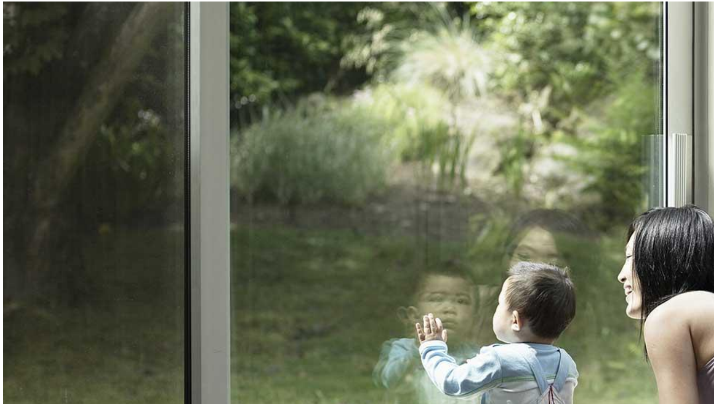
Einbruchschutzglas STADIP PROTECT.jpg