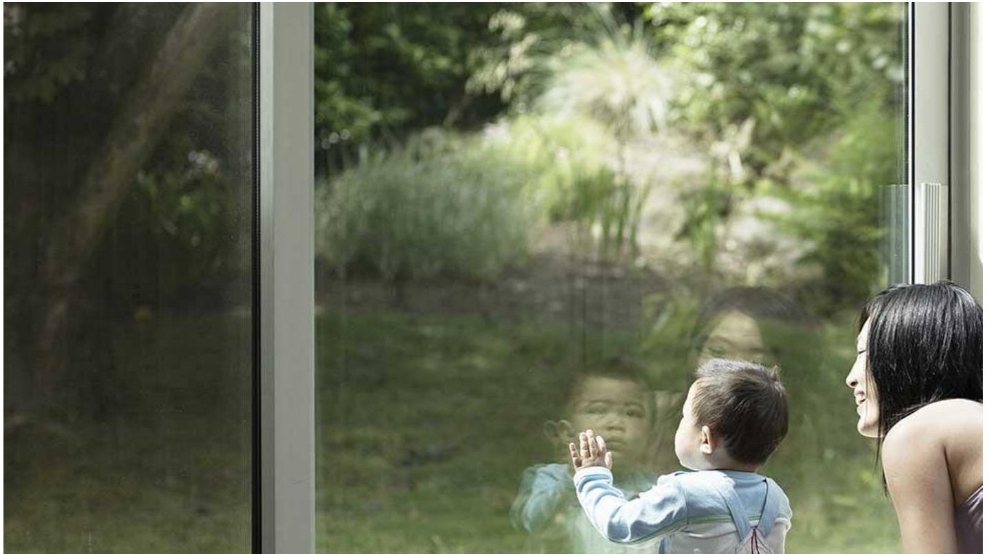
Einbruchschutzglas STADIP PROTECT.jpg