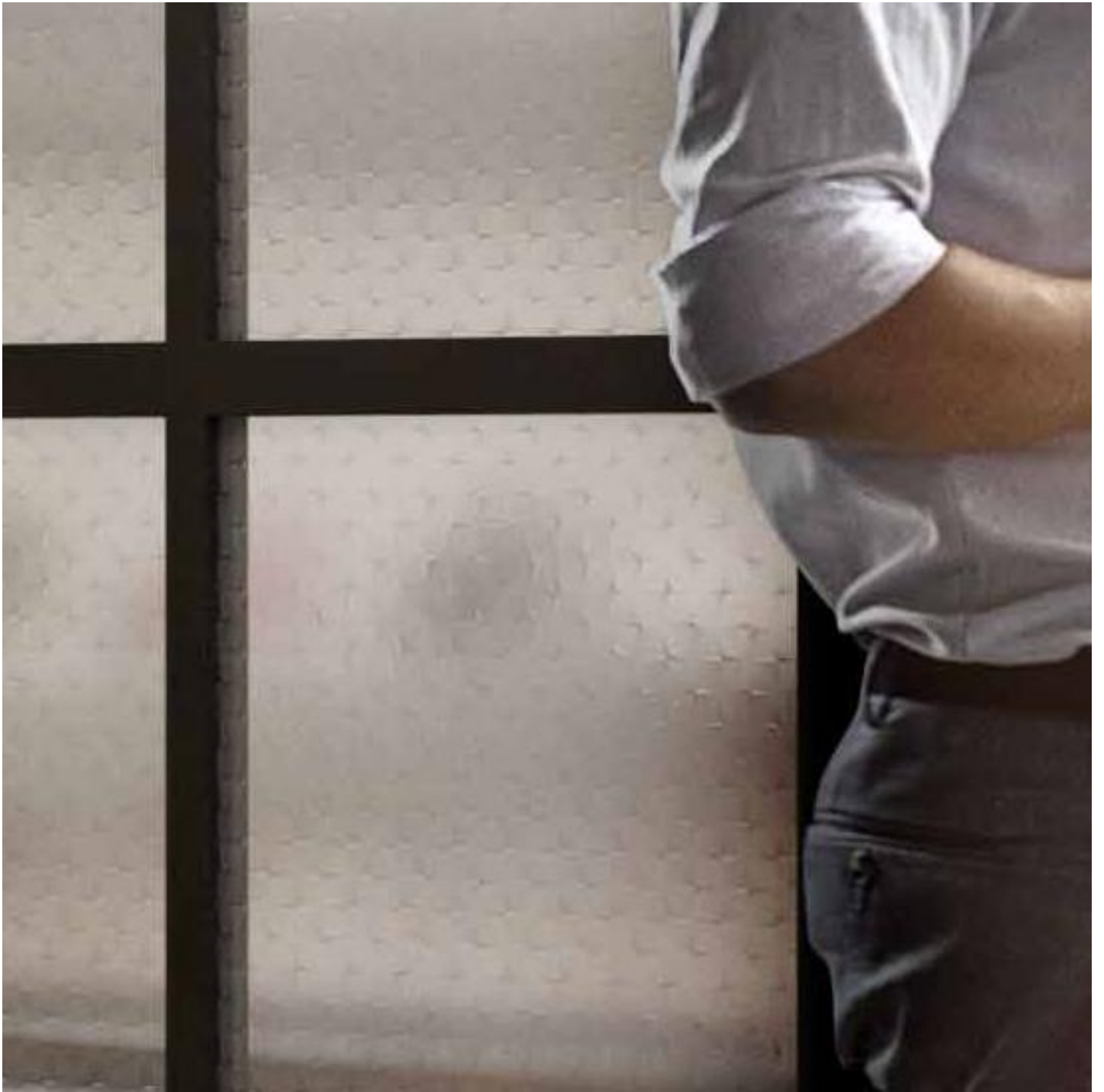
DECORGLASS & MASTERGLASS