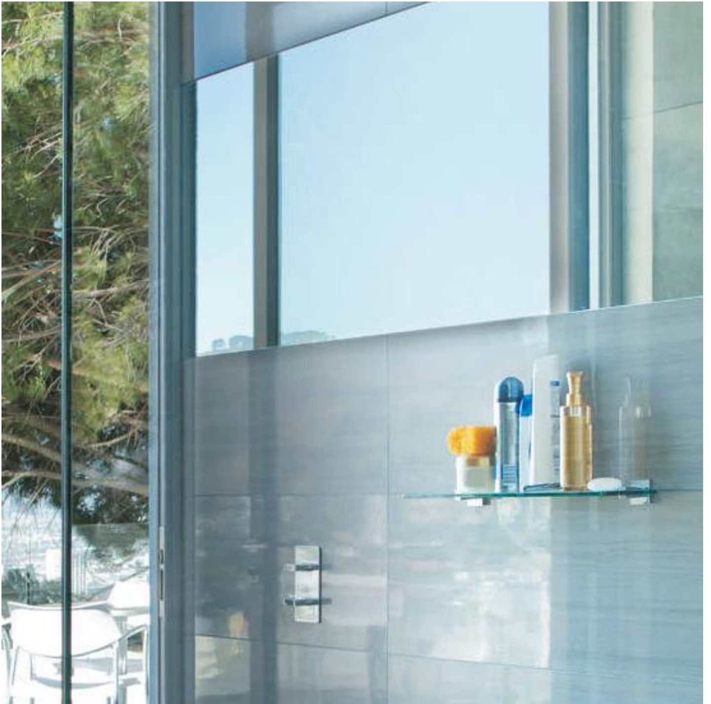
TIMELESS GLASS SHOWER