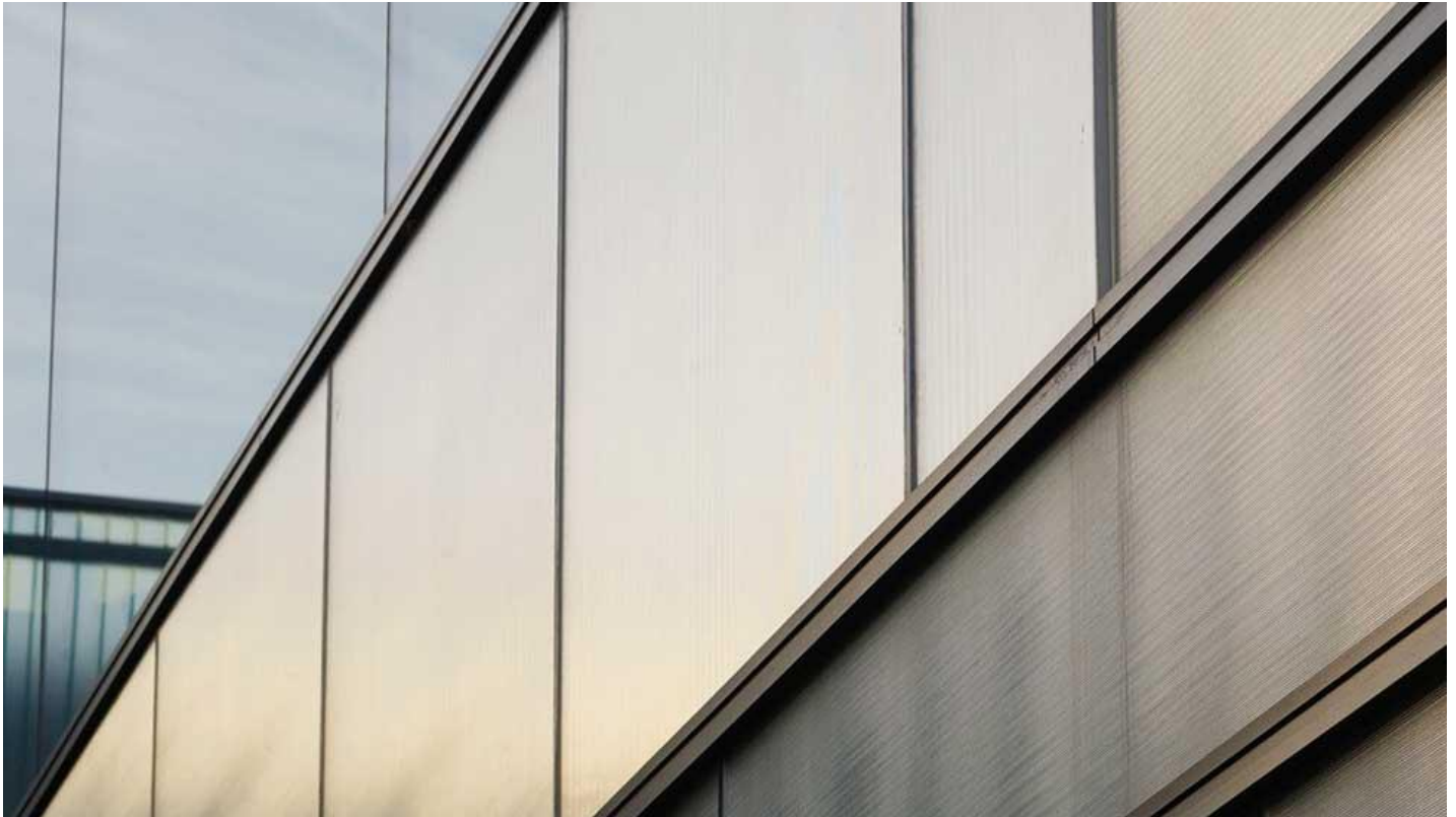
COOL-LITE BRIGHT SILVER | Saint-Gobain Building Glass