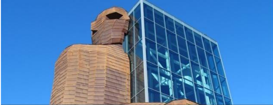
COOL-LITE SKN 154 | Saint-Gobain Building Glass