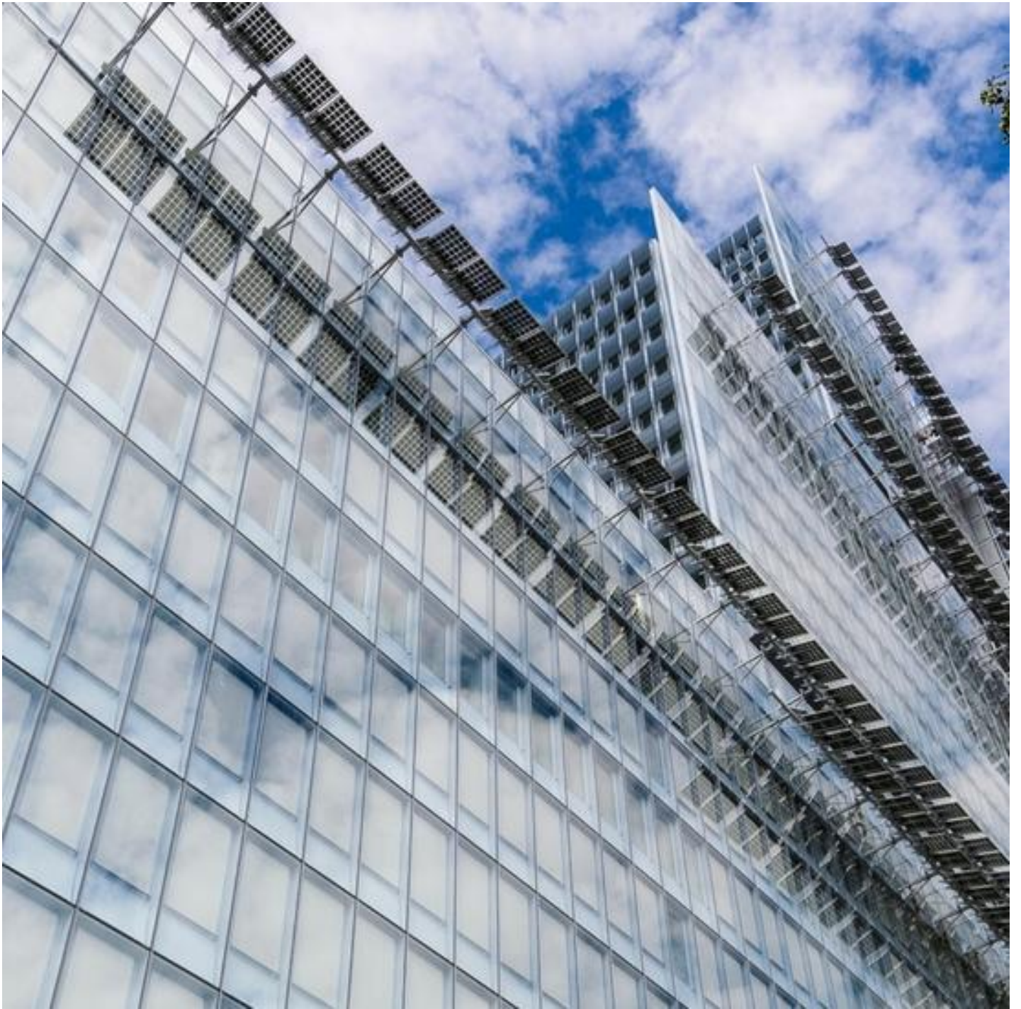
COOL-LITE ST BRIGHT SILVER