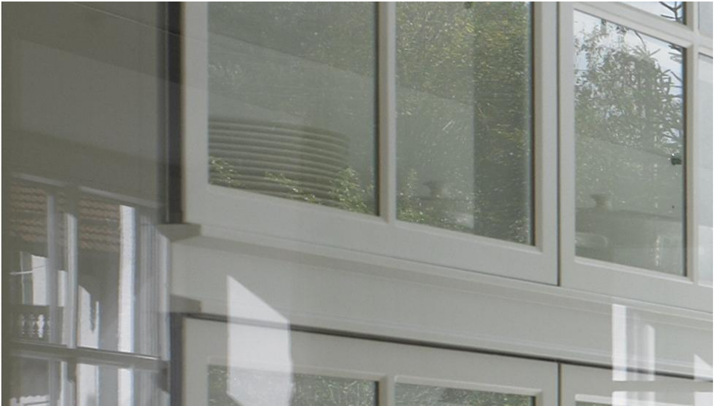
COOL-LITE SKN 154 | Saint-Gobain Building Glass