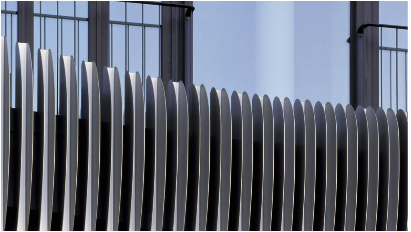
COOL-LITE SKN 154 | Saint-Gobain Building Glass