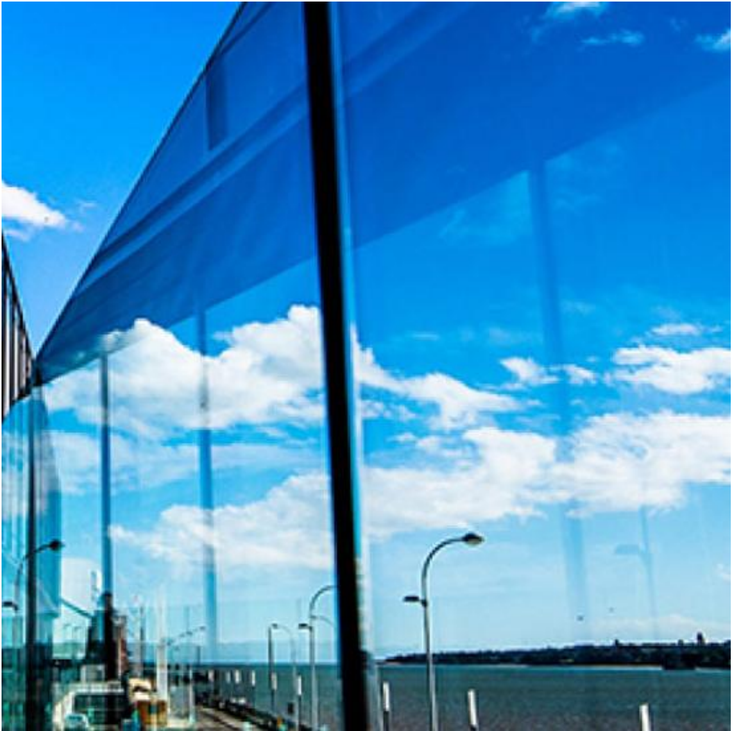
COOL-LITE XTREME 50/22 II