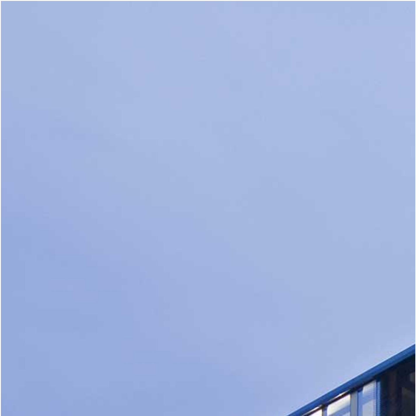
COOL-LITE ST 150