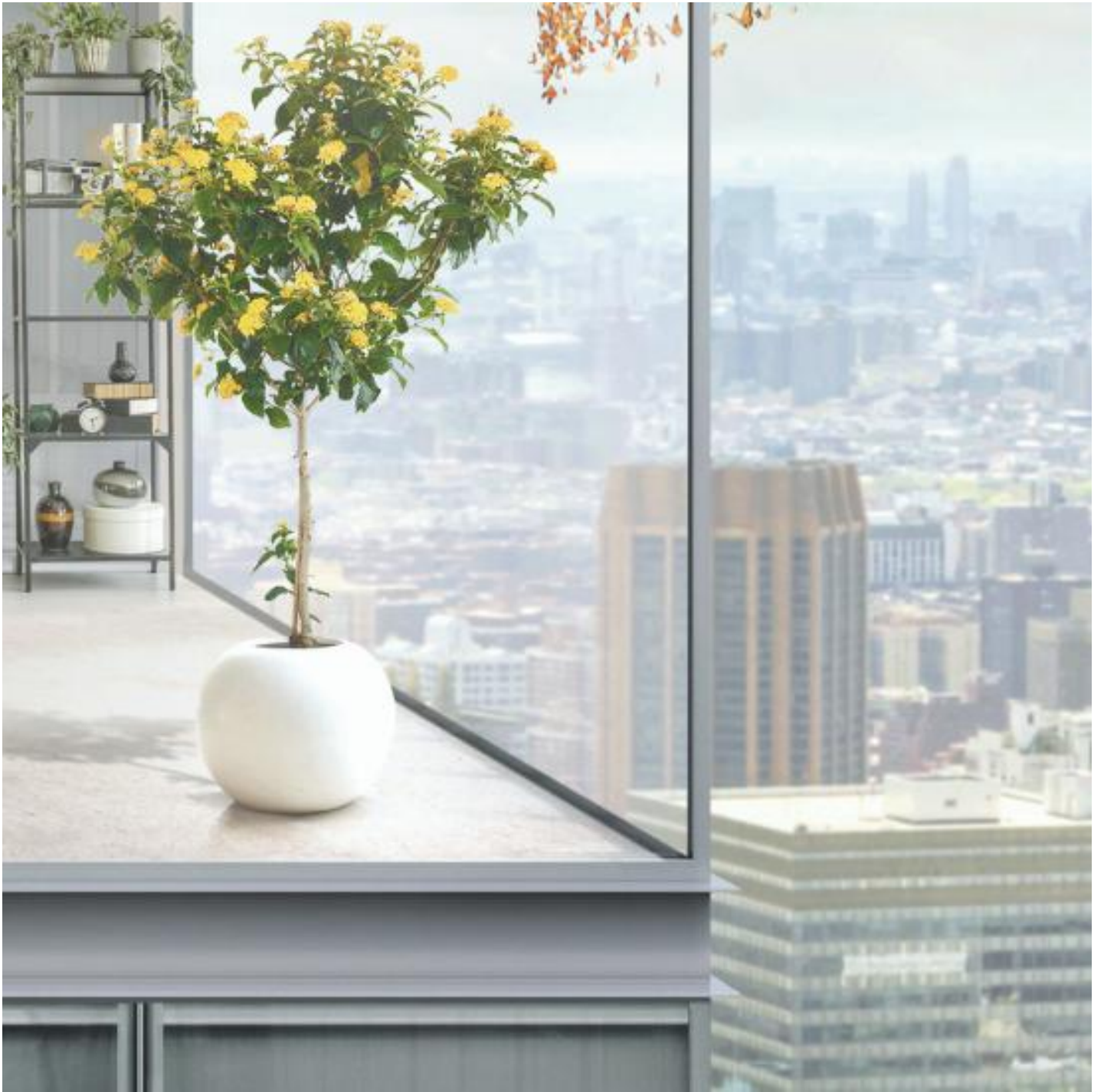
COOL-LITE XTREME 70/33