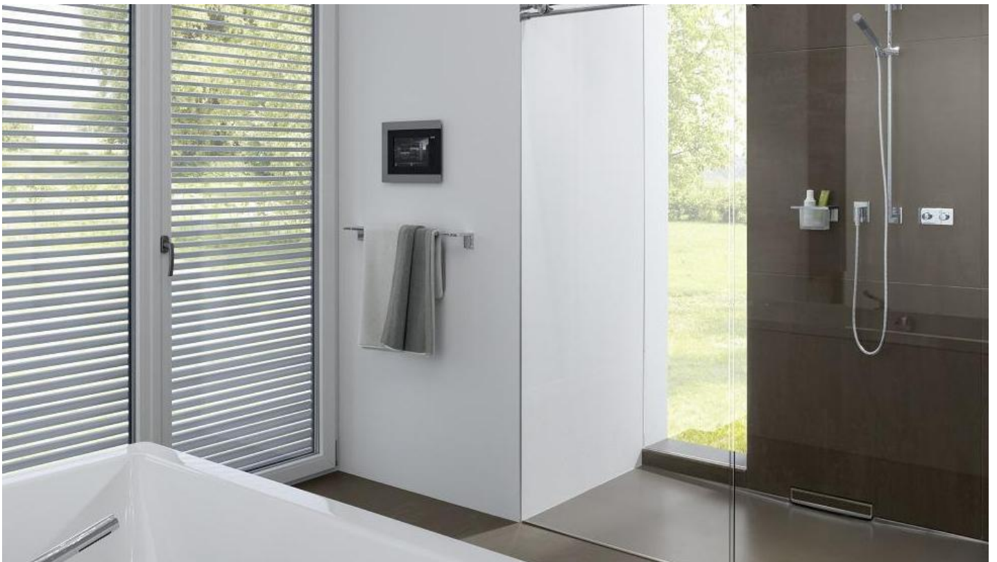
Parois de douche en PLANICLEAR pour le TIMELESS GLASS SHOWER