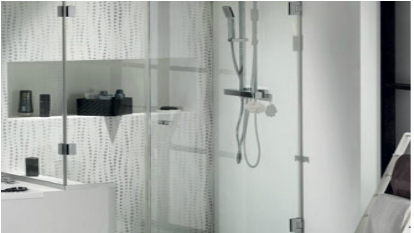
PLANICLEAR | Le nouveau standard du verre claire