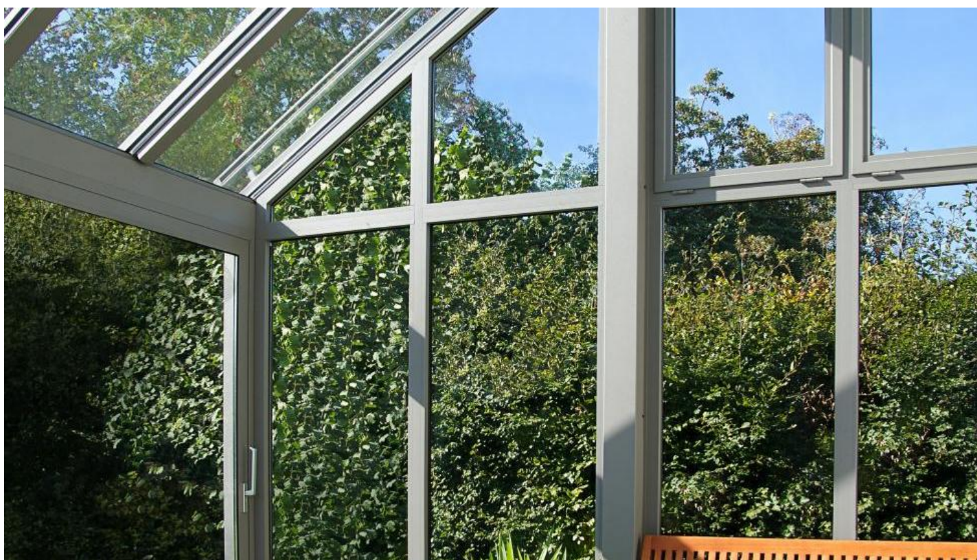
Beglazing voor veranda's & serres