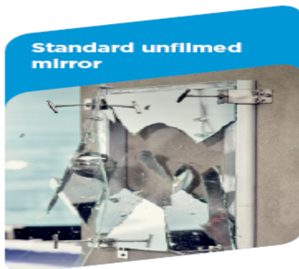
Anti-shatter test - TÜV Rheinland