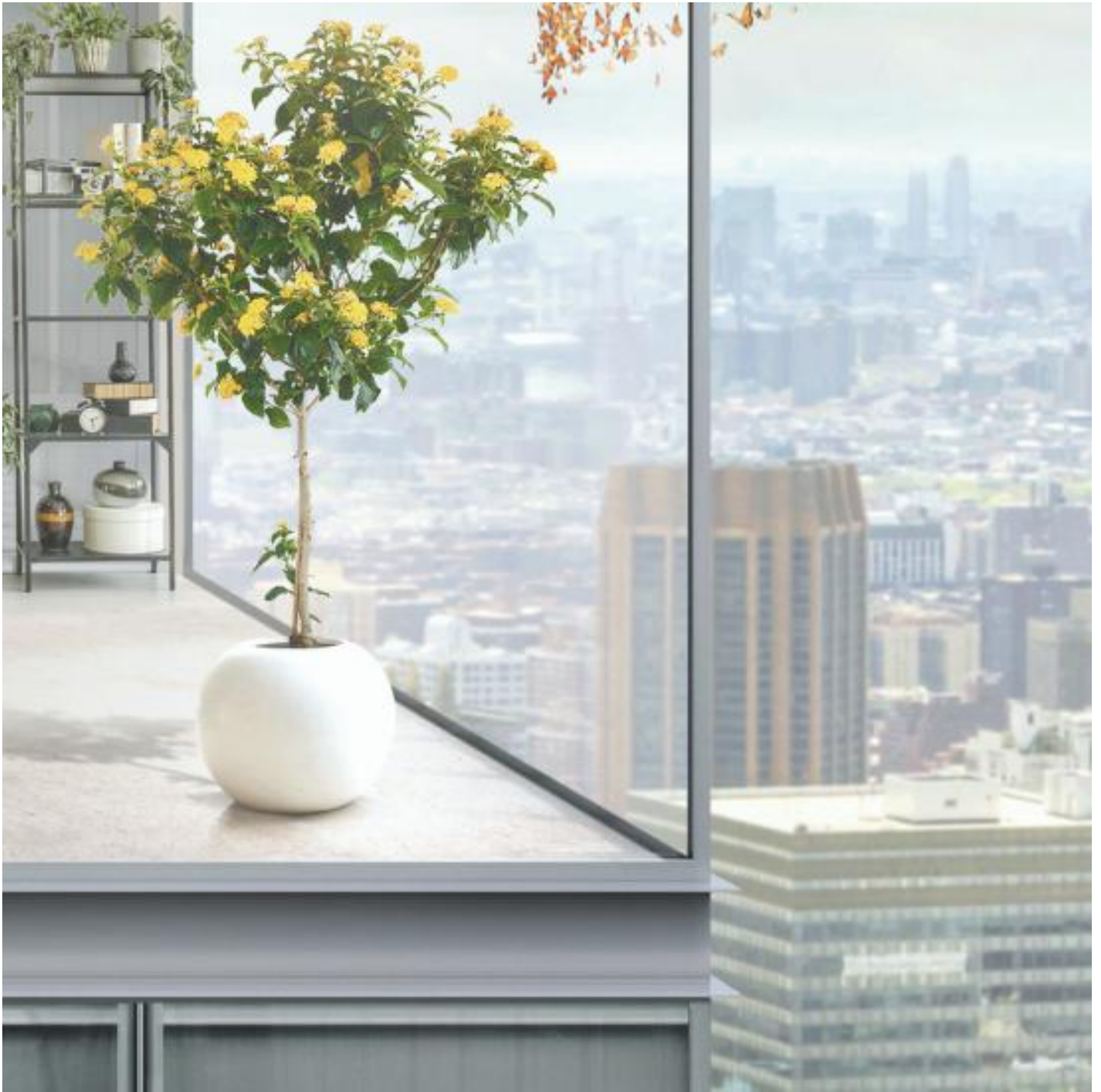
COOL-LITE XTREME 70/33